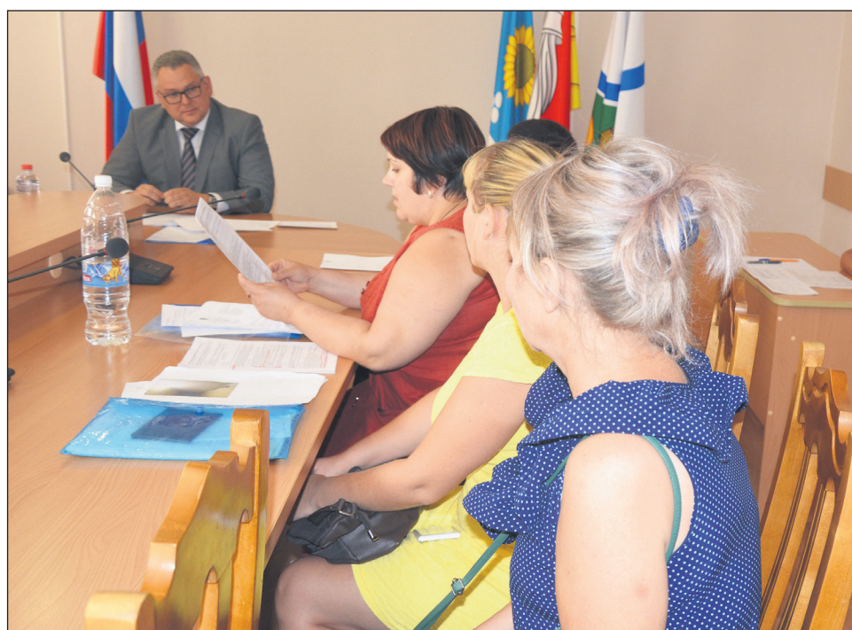
Приём ведёт руководитель департамента образования и молодёжной политики Воронежской области Олег Мосолов, август 2017 года

В то же время, как отмечает Виктор Квасов, в 2017 году в 2,5 раза увеличилось число обращений по вопросам образования и более чем в 5 раз — по проблемам здравоохранения.